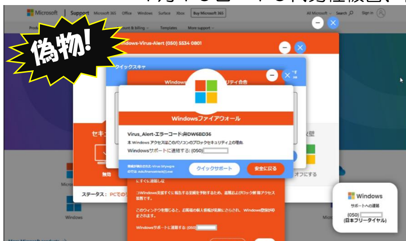
【実際の偽警告画面の一例】

※ 被害状況 1月6日 70代男性被害、被害額13万円 1月10日 70代男性被害、被害額8万円